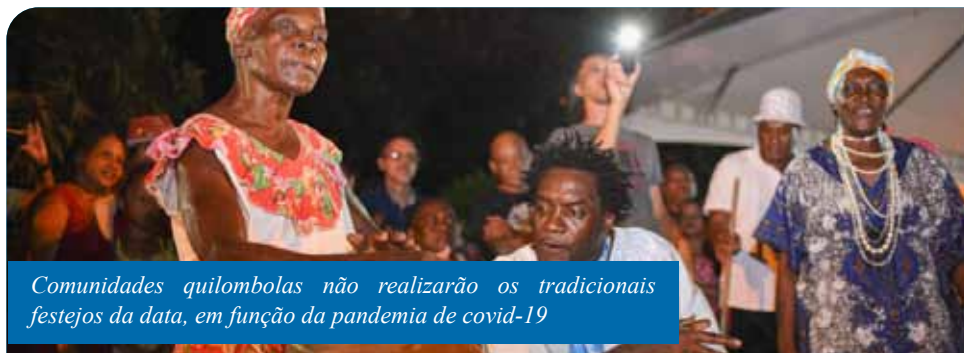
Comunidades quilombolas não realizarão os tradicionais festejos da data, em função da pandemia de covid-19

Atualmente, há 19 mestres e mestras da cultura popular em Cachoeiro beneficiados pela lei, e o valor total de repasses neste ano será de R$ 110.751. “Mesmo diante do contingenciamento de verbas necessário para a administração municipal neste momento de crise, vamos garantir o repasse financeiro aos nossos mestres e mestras. Eles representam a continuidade das tradições populares na nossa cidade,