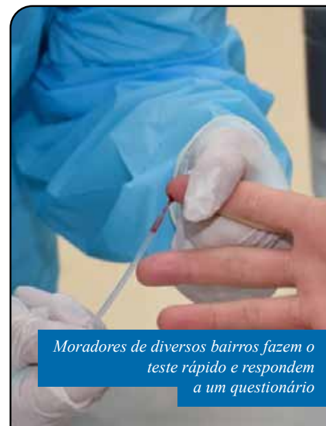
Moradores de diversos bairros fazem o teste rápido e respondem a um questionário

“O inquérito sorológico é uma ação de extrema importância para o combate à Covid-19 no Espírito Santo. Ao final, certamente, teremos um retrato muito mais claro da infecção em nosso