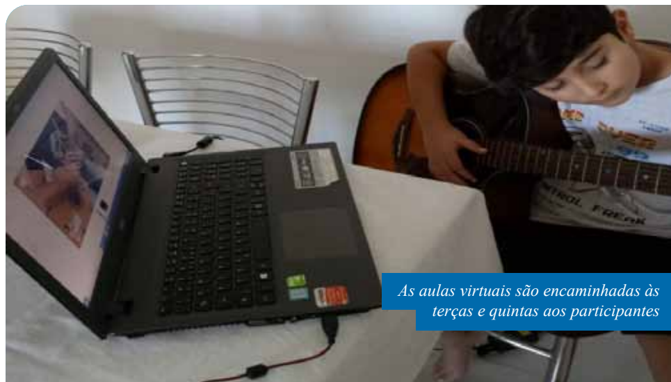
As aulas virtuais são encaminhadas às terças e quintas aos participantes

Alunos das oficinas artísticas que aconteciam nos centros culturais de Cachoeiro também têm dado seguimento ao aprendizado por meio da internet. As aulas são ministradas por entidades selecionadas no último edital de ocupação de espaços culturais, lançado pela Semcult em 2019.