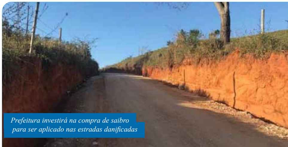
Prefeitura investirá na compra de saibro para ser aplicado nas estradas danificadas

“Mesmo com todos os desafios que o momento atual nos impõe, não podemos abrir mão de atender às demandas essenciais da população. A recuperação dessas estradas gerará uma série de benefícios para a população do interior”, completa o prefeito Victor Coelho.