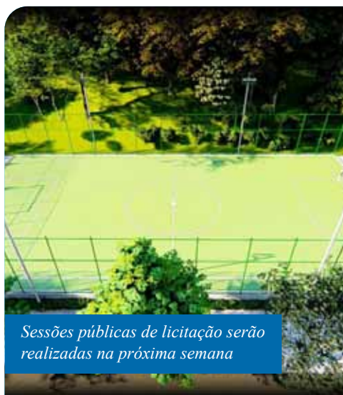
Sessões públicas de licitação serão realizadas na próxima semana

“Uma ótima notícia para a população do distrito de Conduru, graças à captação de recursos, pois