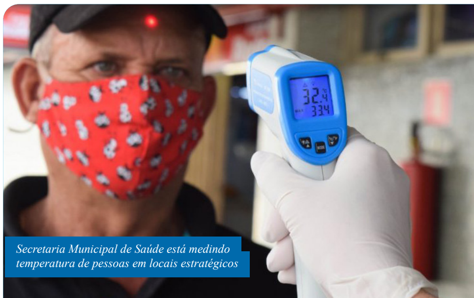
Secretaria Municipal de Saúde está medindo temperatura de pessoas em locais estratégicos

Também ocorre a distribuição de panfletos com orientações importantes, como o uso obrigatório de máscara para quem sai de casa, higienização, isolamento social para o grupo de risco e distanciamento entre as pessoas nas ruas e em filas.