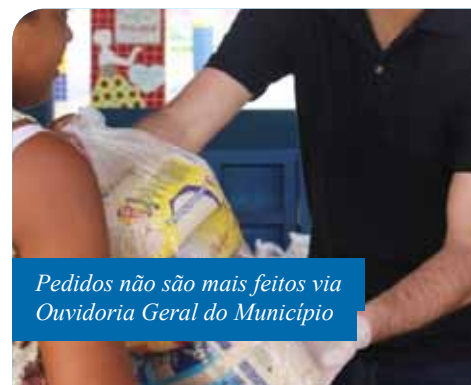
Pedidos não são mais feitos via Ouvidoria Geral do Município