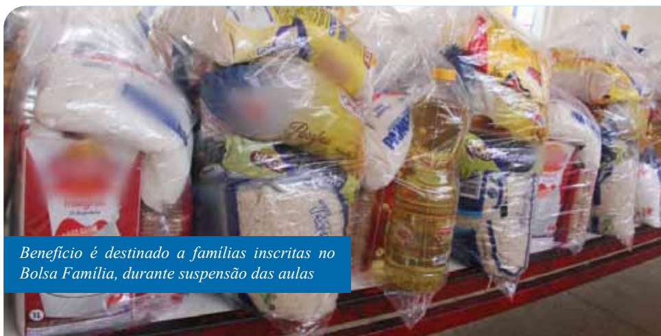
Benefício é destinado a famílias inscritas no Bolsa Família, durante suspensão das aulas

Ainda de acordo com a secretária, cada unidade de ensino possui cronograma próprio de entrega e garante todos os cuidados necessários para evitar aglomerações. “Os beneficiários são contactados pelos gestores escolares para a retirada dos kits”, complementa.