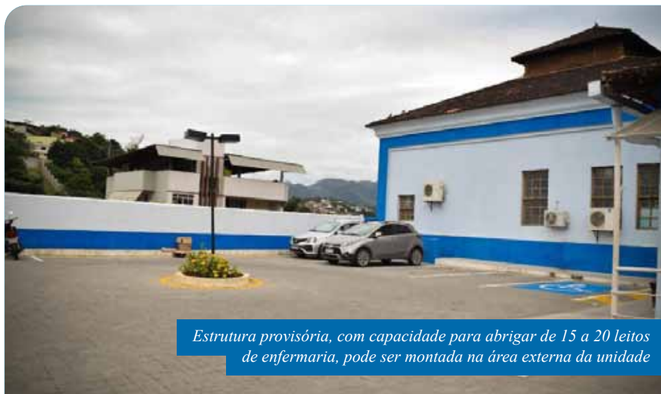
Estrutura provisória, com capacidade para abrigar de 15 a 20 leitos de enfermaria, pode ser montada na área externa da unidade

Ainda de acordo com a secretária, a disponibilização da estrutura, em data a ser definida, é de responsabilidade da Sesa. Equipe e insumos para o atendimento serão disponibilizados pela Secretaria Municipal de Saúde.