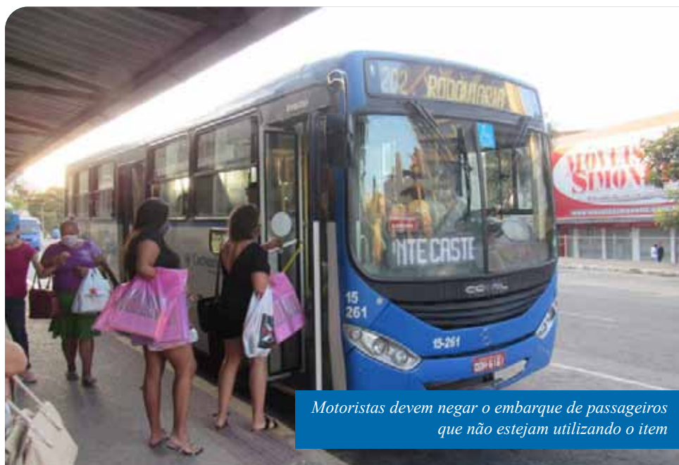
Motoristas devem negar o embarque de passageiros que não estejam utilizando o item

passageiros sendo transportados em pé. A determinação também está de acordo com o decreto de 22 de abril.