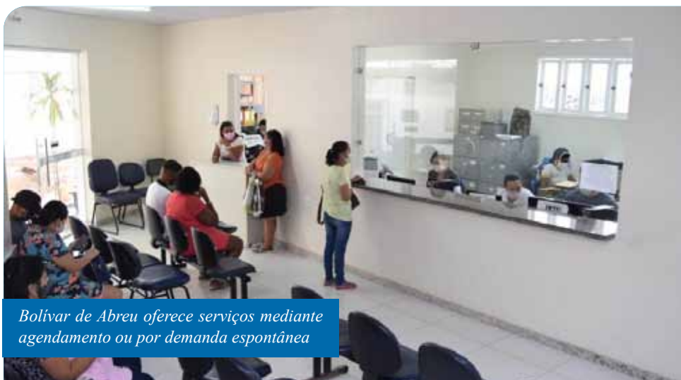
Bolívar de Abreu oferece serviços mediante agendamento ou por demanda espontânea

Alguns dos serviços estiveram interrompidos no período de paralisação do comércio e das atividades administrativas presenciais da Prefeitura de Cachoeiro, mas foram retomados na semana passada. Para combater a propagação do vírus causador da covid-19, o Bolívar de