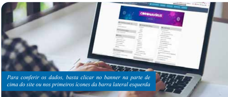
Para conferir os dados, basta clicar no banner na parte de cima do site ou nos primeiros ícones da barra lateral esquerda

Essas informações, agora, também podem ser geradas em diversos formatos, como XML, TXT e CSV (planilha). Além disso, o novo portal disponibiliza, com maior praticidade, um glossário com o significado de termos utilizados na administração municipal – tais como “amortização de dívida” ou “Fundeb” – e uma página de respostas às perguntas mais frequentes.