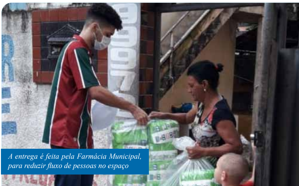
A entrega é feita pela Farmácia Municipal, para reduzir fluxo de pessoas no espaço

Outras medidas preventivas adotadas pela Farmácia Municipal foram: redução do número