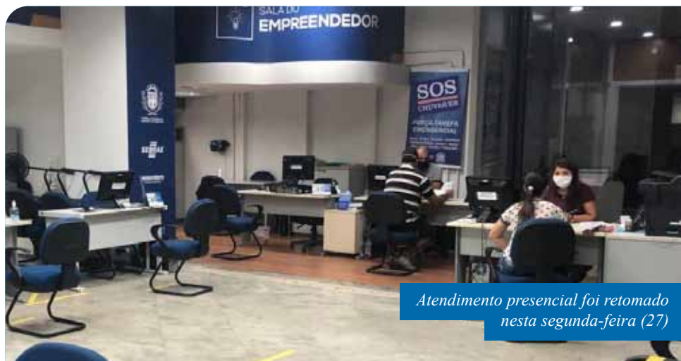
Atendimento presencial foi retomado nesta segunda-feira (27)

Para dar entrada no processo, além de RG,