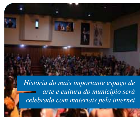
História do mais importante espaço de arte e cultura do município será celebrada com materiais pela internet