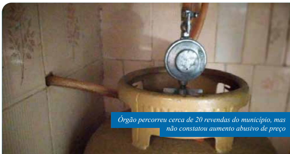
Órgão percorreu cerca de 20 revendas do município, mas não constatou aumento abusivo de preço

Caso o consumidor queira fazer uma denúncia referente ao aumento do preço do gás de cozinha, basta acionar a Ouvidoria Geral do Município, pelo telefone 156, de segunda a sexta, das 9h às 18h, ou pelo Portal do Cidadão ( www.cachoeiro.es.gov.br/ouvidoriageral ). O Procon estadual, que tem contato direto com o órgão municipal, também pode ser acionado pelo telefone 151.