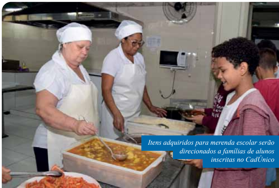
Itens adquiridos para merenda escolar serão direcionados a famílias de alunos inscritas no CadÚnico

“Nós já aguardávamos a publicação da lei e estamos montando kits a serem entregues aos contemplados, entendendo a importância da distribuição dos alimentos para os estudantes e suas famílias. Todos os itens alimentícios já estavam comprados para a merenda escolar. As famílias não precisam se preocupar, porque