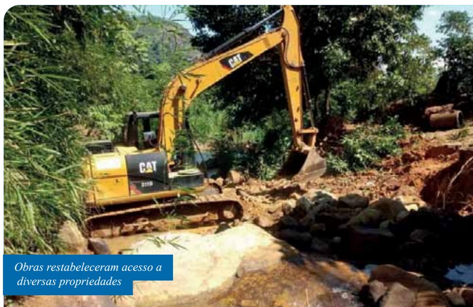
Obras restabeleceram acesso a diversas propriedades

Independência, Monte Verde, São José de Cantagalo e Cachoeira Alta foram contempladas com recentes melhorias em estradas rurais.