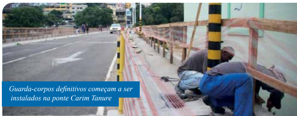
Guarda-corpos definitivos começam a ser instalados na ponte Carim Tanure

“Trabalhamos cada dia mais para recuperar os prejuízos causados pela enchente de 25 de janeiro, que não foram poucos. Agora, enfrentamos um novo desafio com a pandemia do novo coronavírus, mas a administração municipal não pode parar – sempre, claro, adotando todos os cuidados de segurança”, afirma o prefeito Victor Coelho.