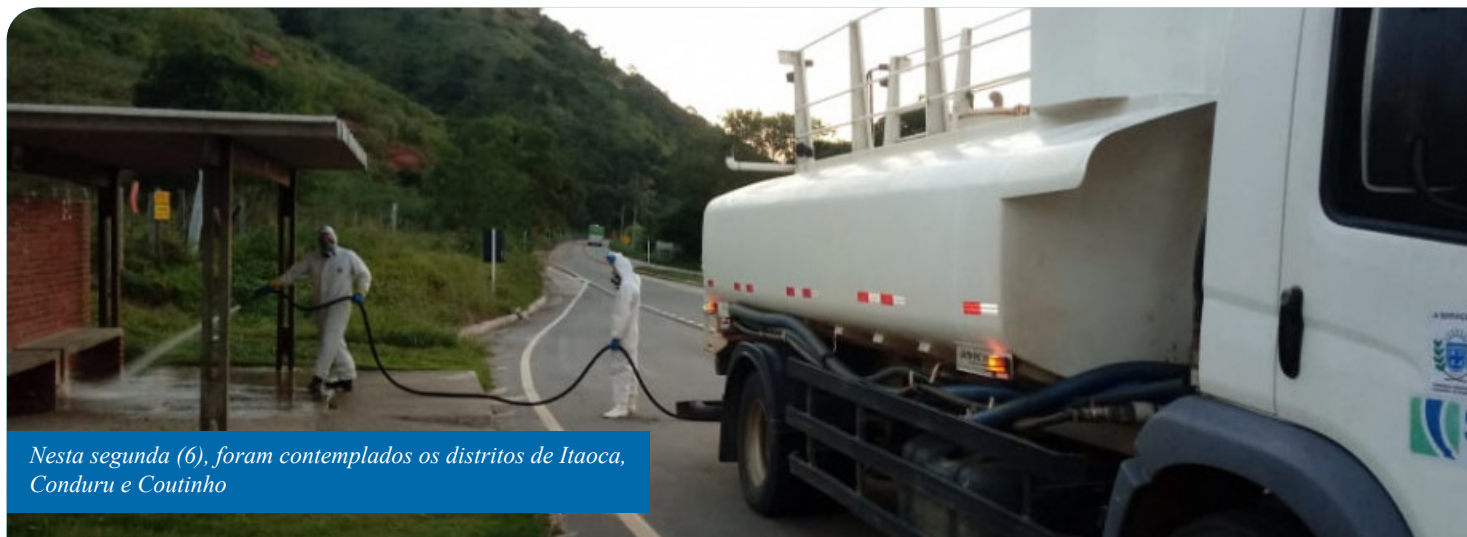
Nesta segunda (6), foram contemplados os distritos de Itaoca, Conduru e Coutinho

Na sede do município, a ação foi iniciada no último dia 24 e segue sendo feita. Dentre os locais que recebem a higienização, estão hospitais, unidades básicas e de Pronto Atendimento, pontos de ônibus e a Ceasa Sul.