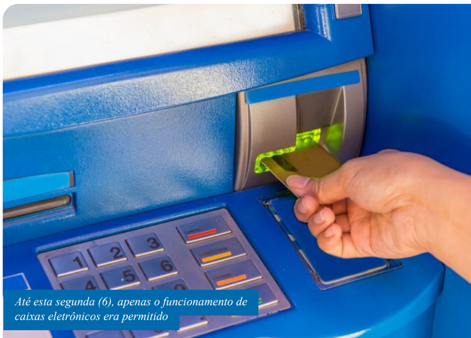
Até esta segunda (6), apenas o funcionamento de caixas eletrônicos era permitido

O novo decreto municipal, seguindo o estadual, também libera os atendimentos de pessoas com doenças graves, mas mantém suspensos os demais atendimentos ao público nas agências bancárias, públicas e privadas, até o dia 18 de abril.