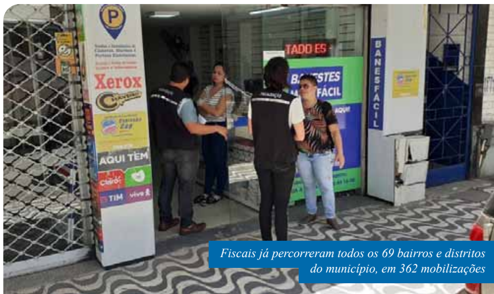
Fiscais já percorreram todos os 69 bairros e distritos do município, em 362 mobilizações

“Os fiscais estão todos os dias da semana nas ruas atuando, firmemente, para que as medidas de isolamento social sejam cumpridas. É muito importante que a população faça a sua parte, conscientizando-se e denunciando quem está descumprindo. Quanto mais eficácia tivermos com o isolamento, mais cedo conseguiremos superar este momento difícil”, destaca o