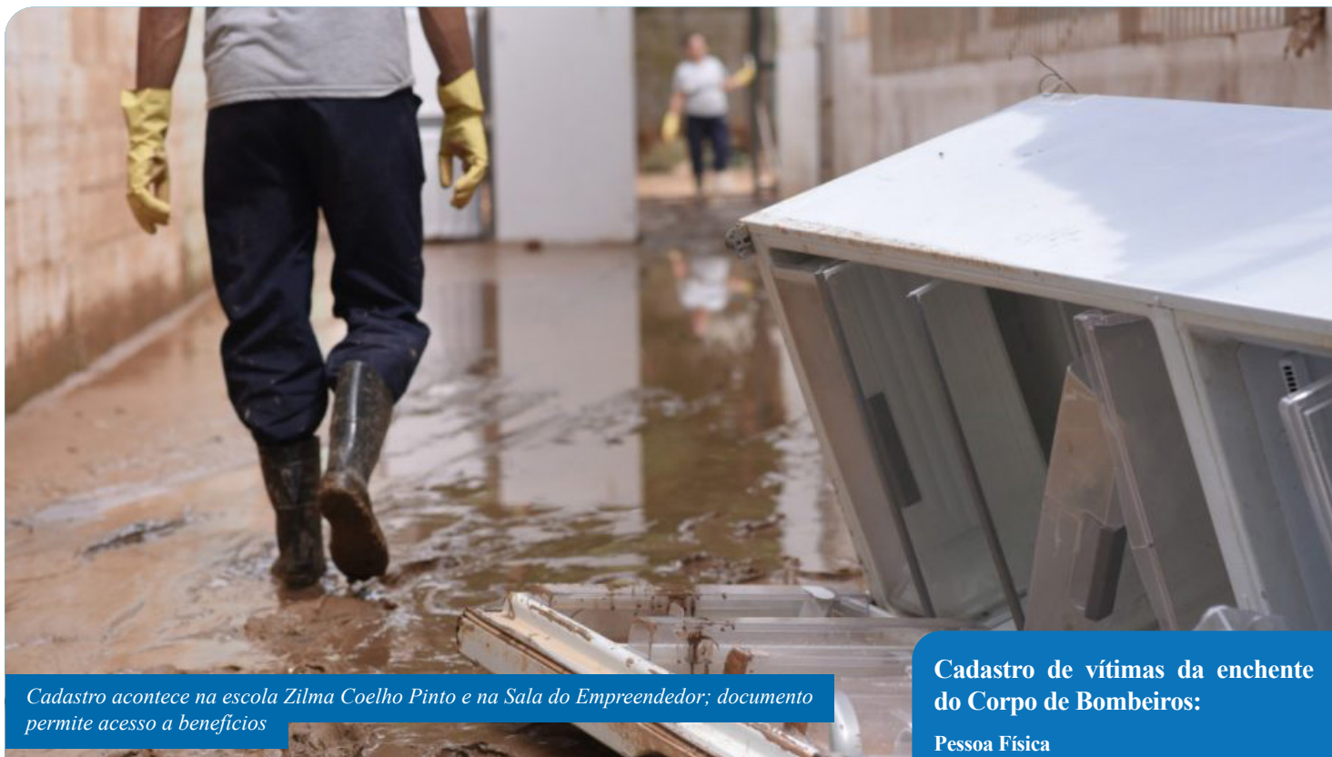
Cadastro acontece na escola Zilma Coelho Pinto e na Sala do Empreendedor; documento permite acesso a benefícios

O Corpo de Bombeiros Militar realiza, até sexta-feira (7), uma ação especial de cadastro de pessoas afetadas pela enchente em Cachoeiro de Itapemirim. A atividade, que tem apoio da Prefeitura de Cachoeiro, é direcionada a moradores e empreendedores, que poderão obter o Formulário de Identificação de Afetados, documento importante para acesso a benefícios a nível municipal, estadual e federal.