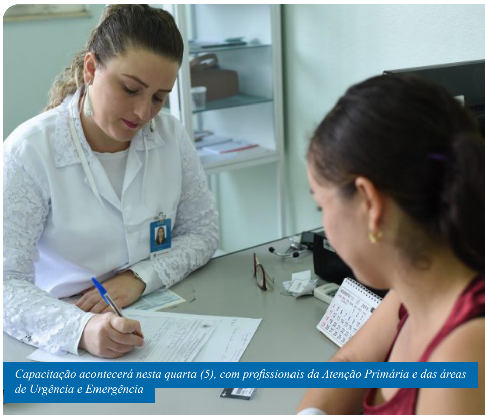
Capacitação acontecerá nesta quarta (5), com profissionais da Atenção Primária e das áreas de Urgência e Emergência