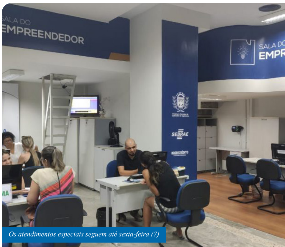
Os atendimentos especiais seguem até sexta-feira (7)

“O intuito desses atendimentos especiais na