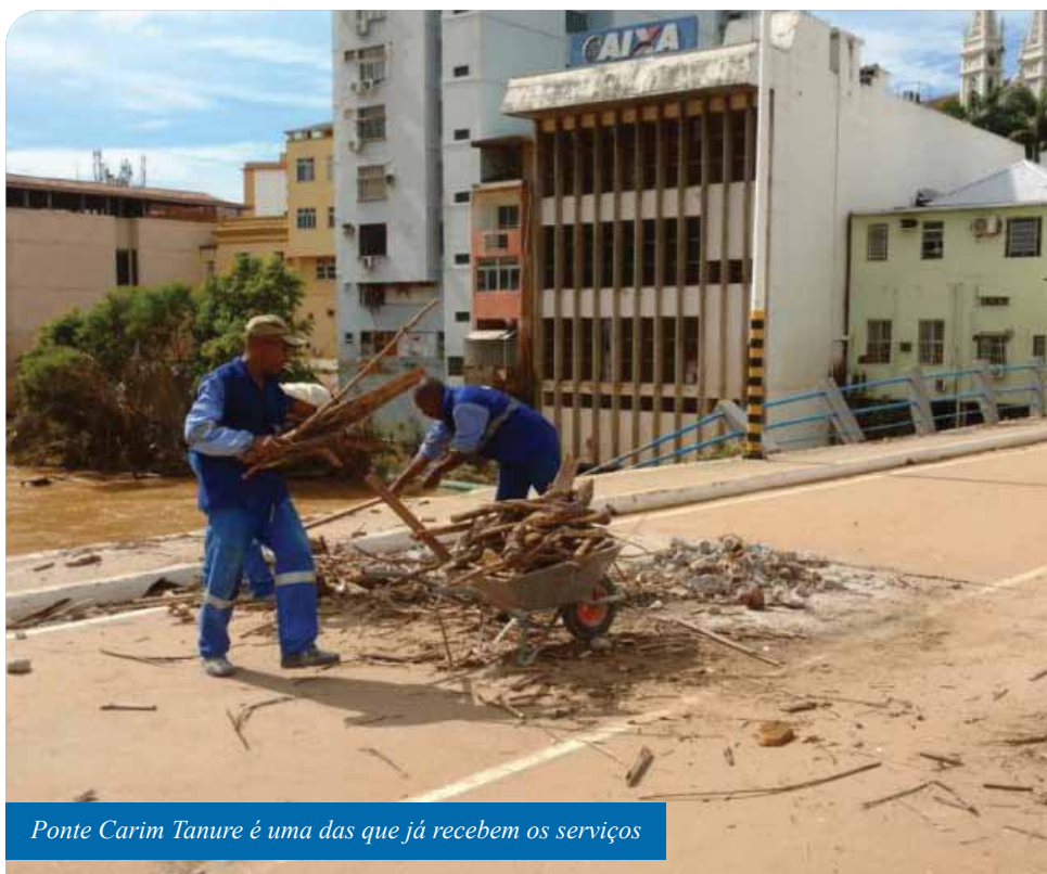
Ponte Carim Tanure é uma das que já recebem os serviços

No caso da ponte Guadalajara, foi encontrada uma avaria em um dos pilares de sustentação da