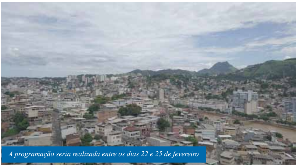
A programação seria realizada entre os dias 22 e 25 de fevereiro