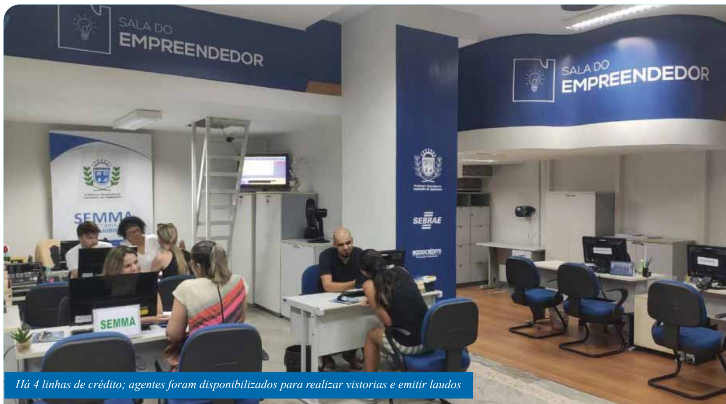
Há 4 linhas de crédito; agentes foram disponibilizados para realizar vistorias e emitir laudos

A Sala do Empreendedor da Prefeitura de Cachoeiro está prestando atendimento sobre linhas de crédito emergenciais para os comerciantes e empreendedores afetados pela enchente. O crédito emergencial é oriundo do Fundo Reconstrução ES, lançado pelo Banco de Desenvolvimento do Espírito Santo (Bandes) e operado pelo Banestes para a recuperação da atividade econômica dos municípios afetados.