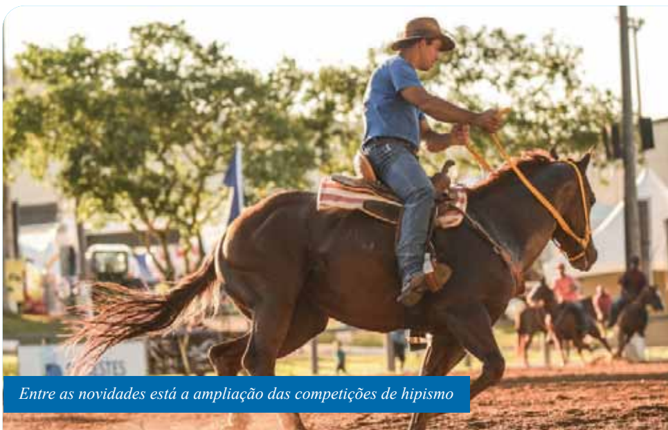
Entre as novidades está a ampliação das competições de hipismo

“A expectativa é muito grande em Cachoeiro