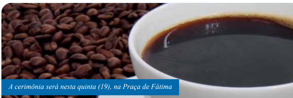
A cerimônia será nesta quinta (19), na Praça de Fátima

A divulgação dos melhores cafés produzidos em Cachoeiro será realizada em grande estilo, nesta quinta-feira (19), a partir das 18h, em plena Praça de Fátima, centro da cidade, com direito a degustação para o público e programação especial. É o evento Café na Praça, de premiação do Concurso de Qualidade e Sustentabilidade do Café Conilon 2019, promovido pela Prefeitura.