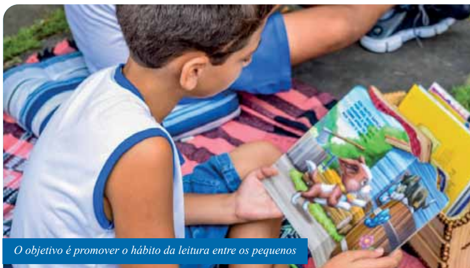
O objetivo é promover o hábito da leitura entre os pequenos

“Queremos que as pessoas olhem para os livros como belas opções de presentes, que, neste Natal,