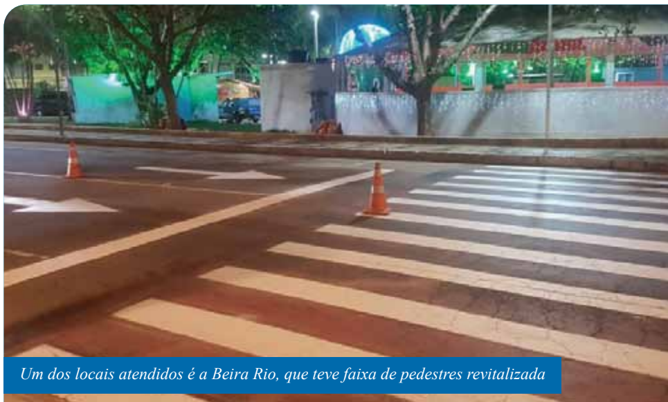
Um dos locais atendidos é a Beira Rio, que teve faixa de pedestres revitalizada

Outra recente ação da Semdurb com foco na