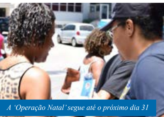
A 'Operação Natal' segue até o próximo dia 31

A Guarda Civil Municipal de Cachoeiro de Itapemirim iniciou, nesta segunda-feira (16), uma ação para divulgar dicas de segurança para a hora das compras de fim de ano.