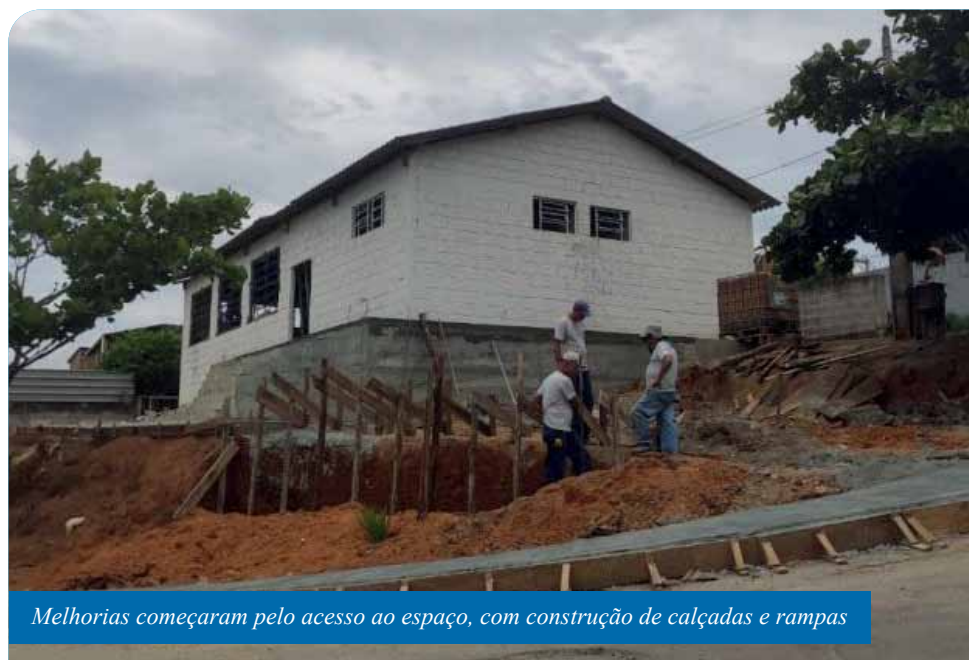
Melhorias começaram pelo acesso ao espaço, com construção de calçadas e rampas

“Estamos muito felizes por conseguirmos realizar essa terceira edição do Transforma Cachoeiro, mesmo com tantas chuvas, e realizar a entrega do Centro Comunitário reformado, que sabemos que é um local importante para a população. Nossa expectativa é a melhor possível para o dia 21. Esperamos que todos os moradores