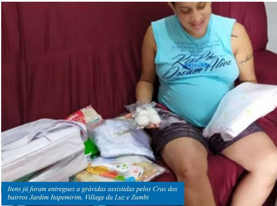
Itens já foram entregues a grávidas assistidas pelos Cras dos bairros Jardim Itapemirim, Village da Luz e Zumbi