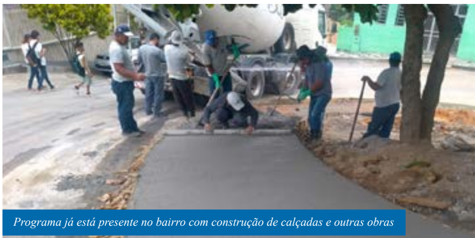
Programa já está presente no bairro com construção de calçadas e outras obras

Mais de 60 serviços públicos serão oferecidos aos moradores dessa região, das 9h às 15h, na estrutura que será montada na área que engloba o campo de futebol do Bela Vista e as ruas Sebastião José Machado e Olívia das Dores Rodrigues.