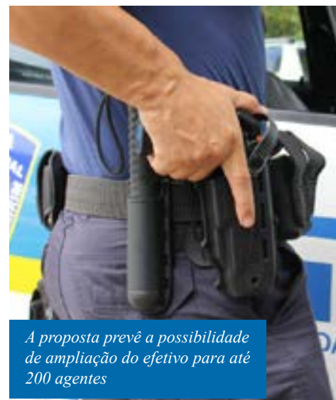
A proposta prevê a possibilidade de ampliação do efetivo para até 200 agentes

A prefeitura assinou, em novembro, um Acordo de Cooperação Técnica com a Polícia Federal (PF) para a volta da concessão de porte de arma de fogo aos integrantes da GCM. Atualmente, a Delegacia de Armas e Munições da PF (Delarm)