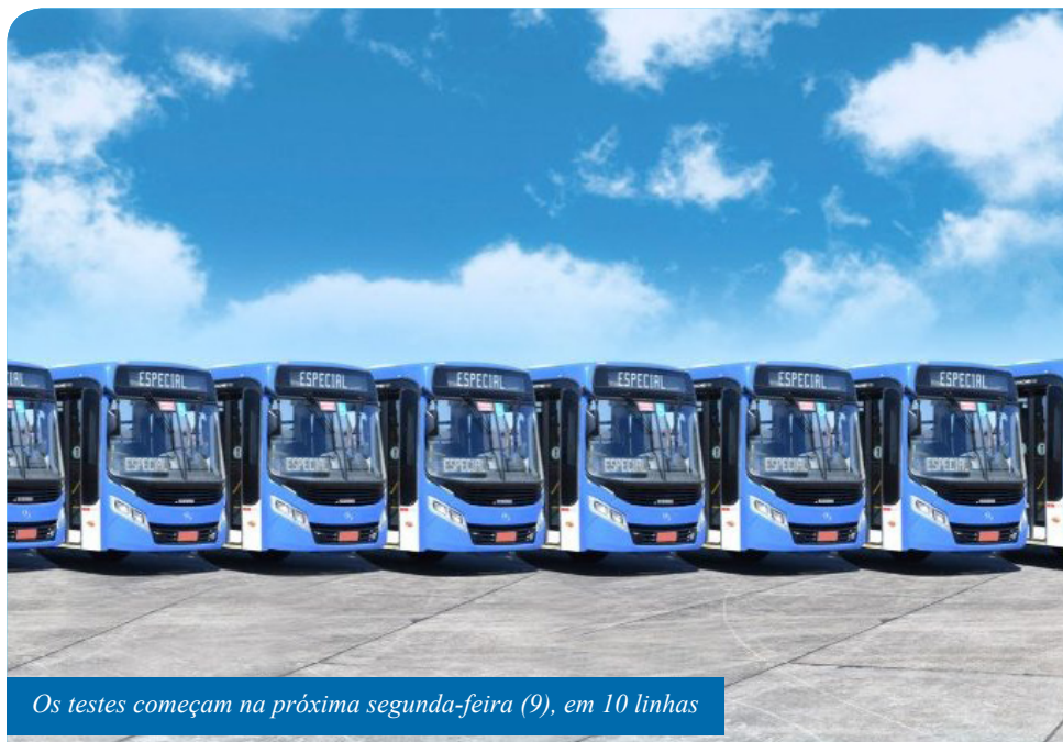
Os testes começam na próxima segunda-feira (9), em 10 linhas

Ainda de acordo com o prefeito, está sendo possível propor essa melhoria no transporte coletivo municipal graças ao aprimoramento dos controles dos custos do serviço, ao equilíbrio contratual viabilizado pelo subsídio tarifário e aos novos veículos que passaram a integrar a frota neste ano, fruto de um Termo de Ajustamento de Conduta (TAC), firmado entre Agersa, Prefeitura