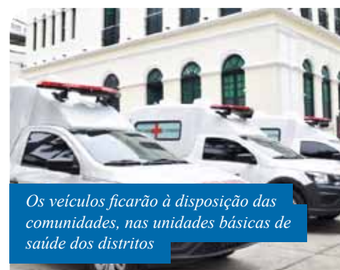
Os veículos ficarão à disposição das comunidades, nas unidades básicas de saúde dos distritos

De acordo com a Secretaria de Saúde, serão entregues mais quatro ambulâncias para as unidades de pronto atendimento em Cachoeiro, no início de 2020.