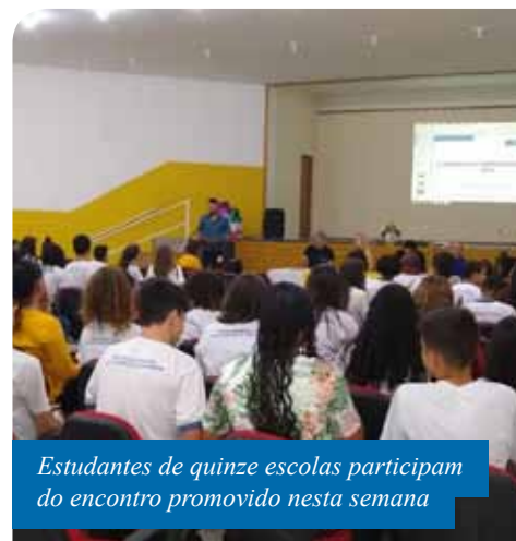
Estudantes de quinze escolas participam do encontro promovido nesta semana

“Proporcionar aprendizado, liderança, voz e vez. Essa é a função dos grêmios e ficamos