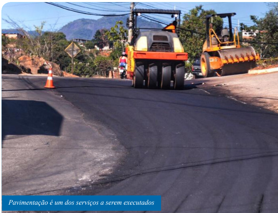
Pavimentação é um dos serviços a serem executados

Em seguida, às 11h, será realizada a entrega das obras de pavimentação e drenagem em seis ruas do Fé e Raça: Juriti, das Gaivotas, das Araras, dos Coleiros, dos Tucanos e do Faisão. A solenidade ocorrerá próximo à escola municipal “Prof.ª Gércia Ferreira Guimarães”. Foram investidos, nas obras, cerca de R$ 500 mil.