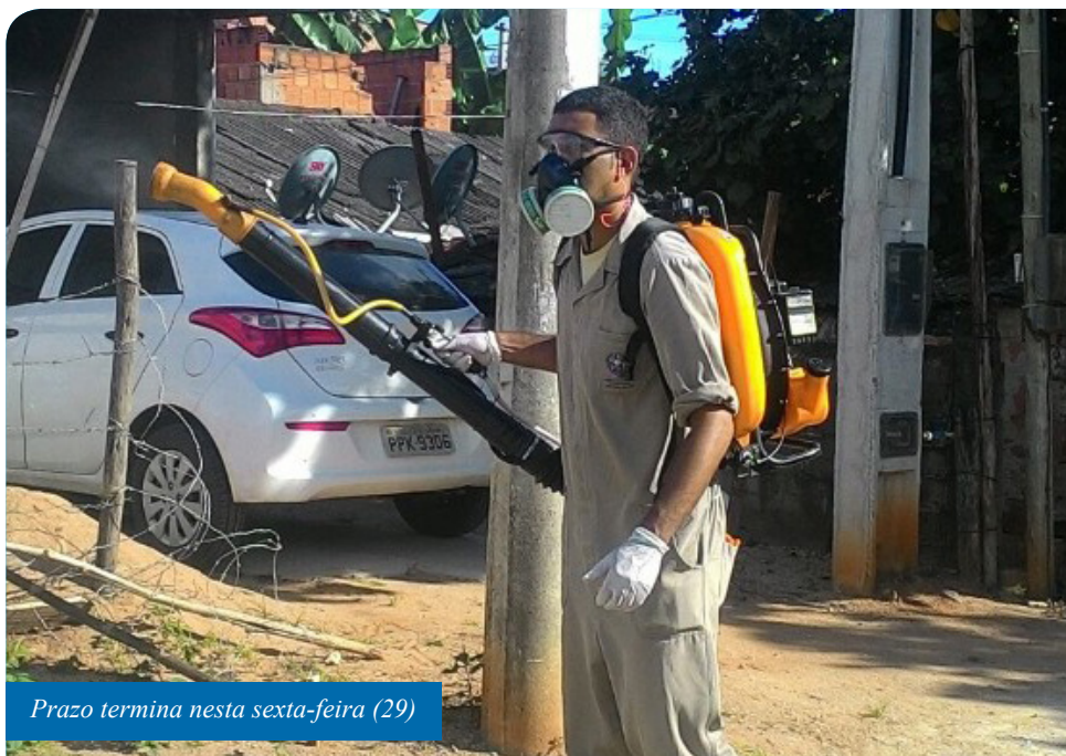
Prazo termina nesta sexta-feira (29)

A prova objetiva será aplicada no dia 12 de janeiro de 2020, em dois turnos. Pela manhã, farão a avaliação os inscritos para agente comunitário de saúde e, à tarde, será a vez dos candidatos a agente de combate a endemias. A prova terá 40 questões e duração de três horas.