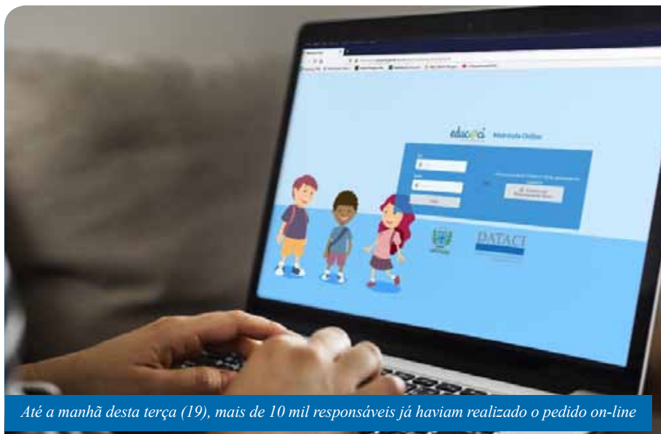
Até a manhã desta terça (19), mais de 10 mil responsáveis já haviam realizado o pedido on-line

A família que não deseje realizar a matrícula