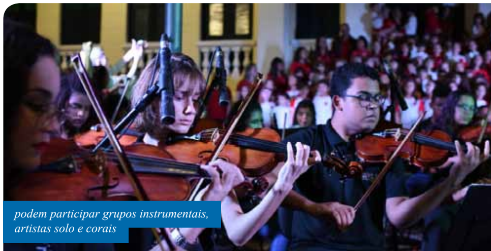
podem participar grupos instrumentais, artistas solo e corais

O edital com todas informações sobre como participar do palco livre do Natal Mágico está disponível no site da Prefeitura de Cachoeiro ( www.cachoeiro.es.gov.br ), em “Editais”, na aba “Transparência”.