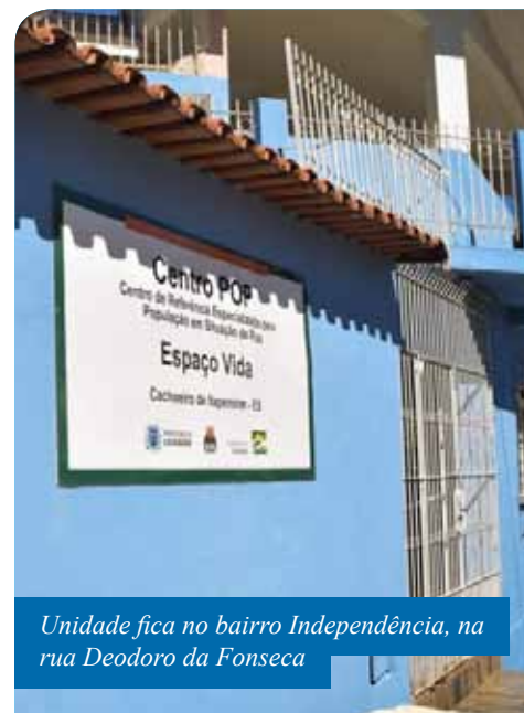
Unidade fica no bairro Independência, na rua Deodoro da Fonseca

A unidade funciona de segunda a sexta-feira, das 7h às 20h, e pode ser procurada de modo espontâneo pela pessoa em situação de rua, por encaminhamento do Serviço