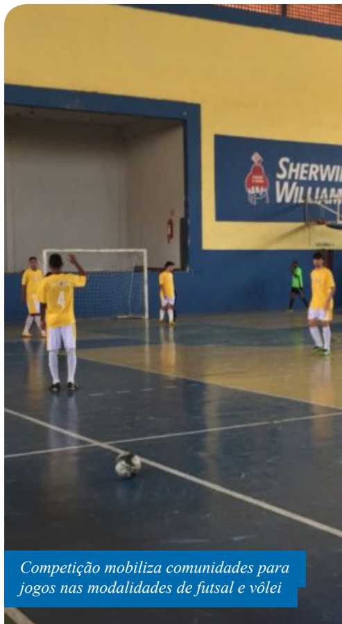
Competição mobiliza comunidades para jogos nas modalidades de futsal e vôlei

“A Taça Nosso Esporte é um momento de descontração, lazer e interação entre os bairros do município. É quando alinhamos a prática de atividades esportivas ao bem-estar dos moradores, com disputas saudáveis”,