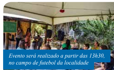
Evento será realizado a partir das 13h30, no campo de futebol da localidade

pela equipe da Semai, dentro do projeto do Circuito de Turismo Rural, também desenvolvido pela secretaria. A iniciativa é realizada mensalmente em uma localidade rural do município.