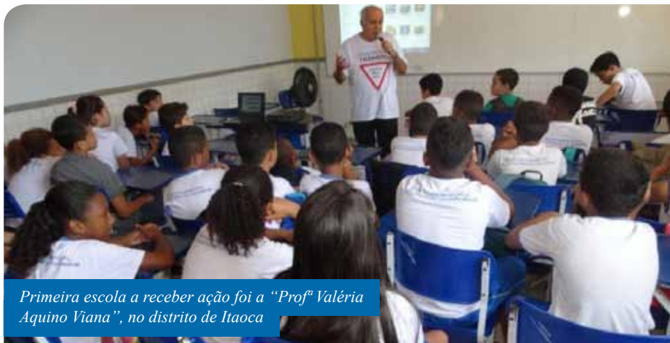
Primeira escola a receber ação foi a “Profª Valéria Aquino Viana”, no distrito de Itaoca