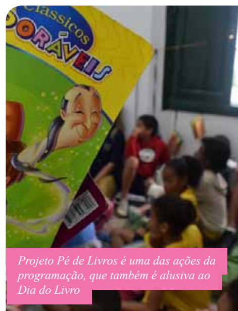
Projeto Pé de Livros é uma das ações da programação, que também é alusiva ao Dia do Livro

Também faz parte da programação a exposição do projeto Cabide de Letras, de