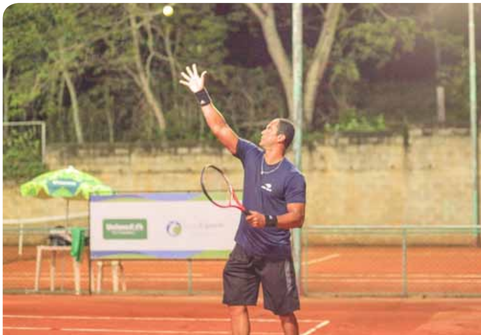
Os interessados devem se inscrever no aplicativo do Nosso Esporte Cachoeiro

“A primeira edição do Open de Tênis foi um sucesso, recebemos competidores de outros municípios e tivemos três atletas de Cachoeiro no pódio. Realizar essa competição, junto a nossos parceiros, permite ampliar o número de atletas atendidos, pois o Clube dos Médicos possui três quadras que são utilizadas,