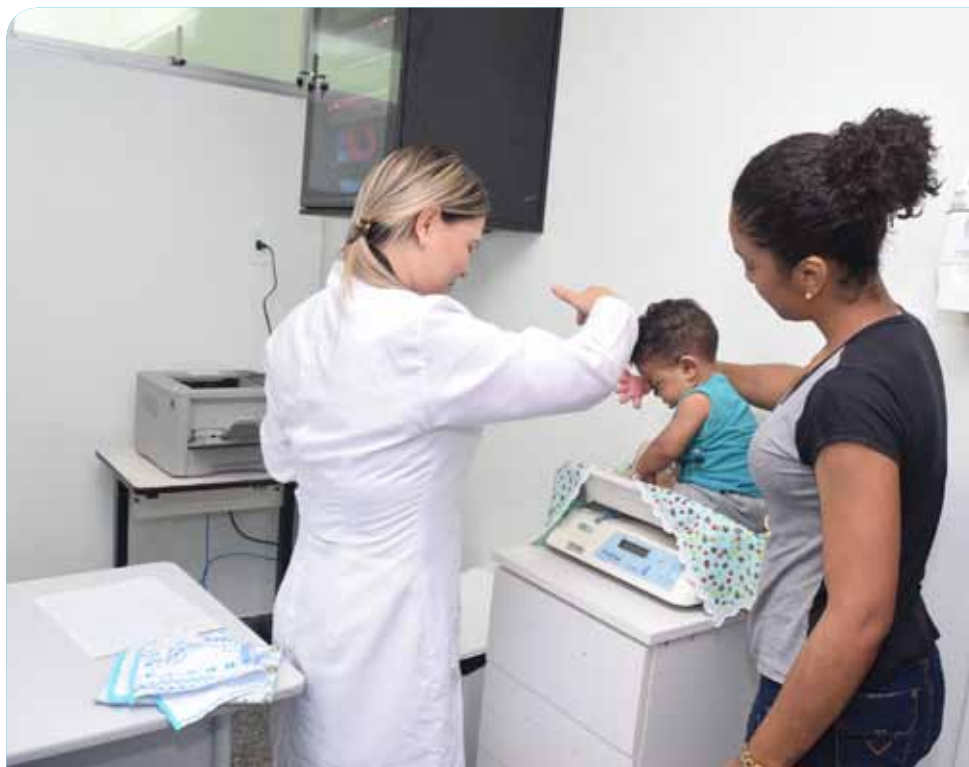
A extensão tem capacidade para atender entre 40 a 50 crianças por dia

“Nossa preocupação é cuidar de pessoas, sobretudo, das crianças. Por isso, estamos felizes pelos atendimentos que estão alcançando aqueles que precisam. Esse esforço comprova que estamos no caminho certo para prestar a melhor assistência para os cidadãos”, salienta