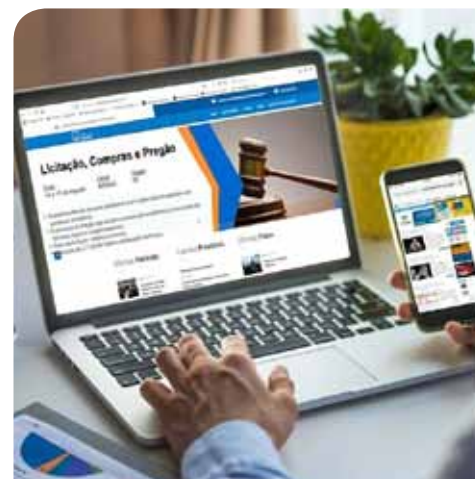
Com o novo layout, ficou mais fácil o agendamento de cursos e outros serviços

Dentre as capacitações já realizadas pela Escola do Servidor, neste ano, estão a palestra motivacional “Desenvolvimento profissional e comportamental no serviço público”, em junho, e um curso de media training, que aconteceu no início de julho. Nos próximos dias 14 e 15 de agosto, haverá o curso “Licitação, Compras e Pregão”.