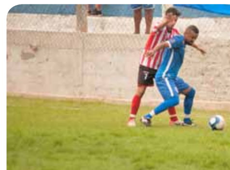
A edição deste ano da competição deverá contar com 16 equipes em quatro grupos