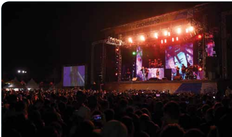
Nenhuma ocorrência policial foi registrada nos quatro dias de evento

A Festa de Cachoeiro, que teve seu pontapé inicial no último dia 22 de junho, com a 41ª Corrida de São Pedro, contou com diversas atrações. Dentre elas, também tiveram destaque o Desfile Cívico Escolar, que atraiu 3 mil expectadores na manhã de sábado (29), e a missa de celebração da Procissão de São Pedro, realizada