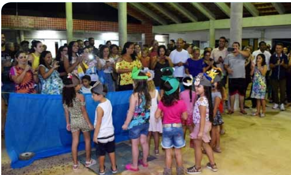
Moradores compareceram à solenidade de reinício das obras, nesta quarta (13)