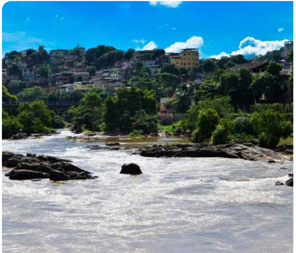
Serão sete dias de atividades de educação ambiental com foco na preservação dos recursos hídricos