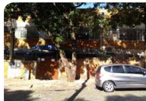
Estudante conta que apoio na escola municipal Anísio Ramos foi fundamental