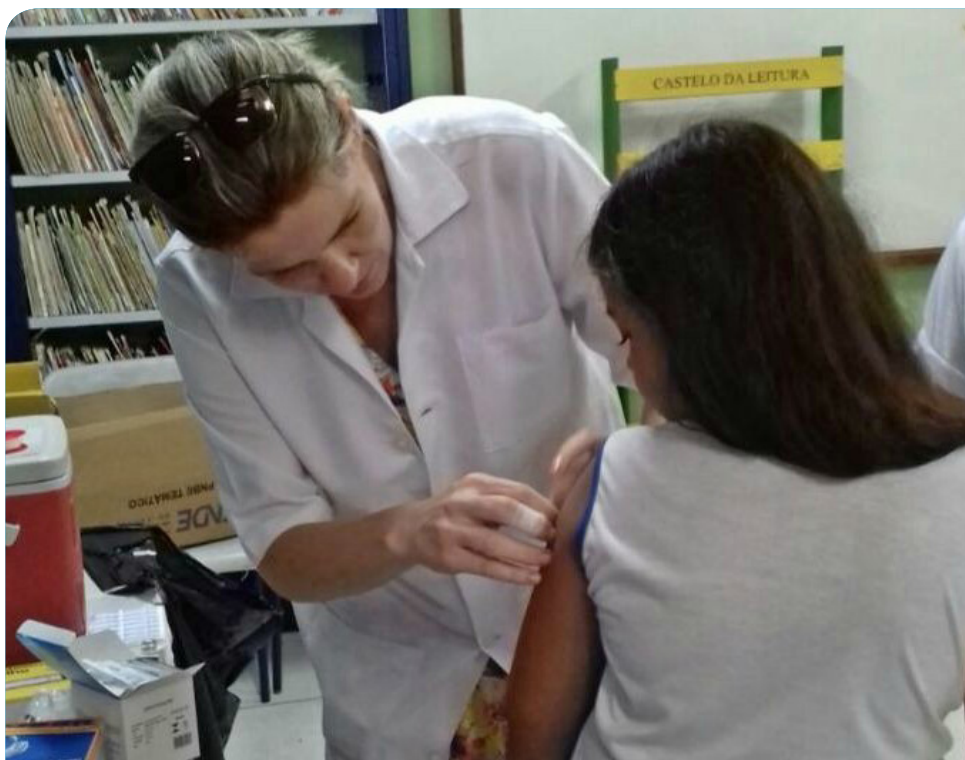
O trabalho terá início em março e vai até dia 15 de abril