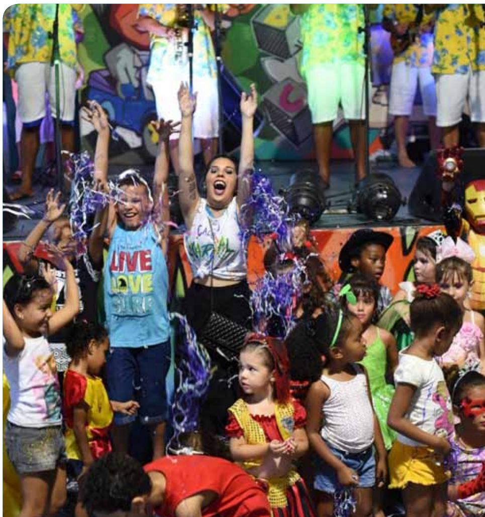
Serão realizadas de domingo (3) à terça-feira (5), no Circo da Cultura

Organizado pela Semcult, o Carnaval de Cachoeiro terá uma diversificada programação, com concursos de Rei Momo e Rainha do Carnaval, de Marchinhas, de Fantasias, desfile de blocos e shows.