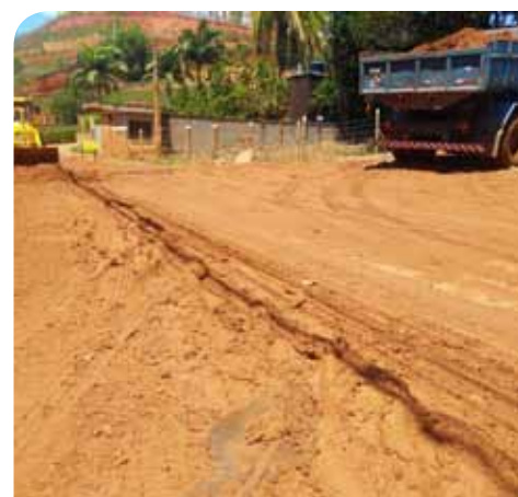
São Lucas (foto) foi um dos bairros atendidos pela ação