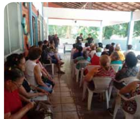
Apresentação de teatro na manhã desta terça (26) animou idosos frequentadores

O horário de funcionamento é de segunda a sexta-feira, das 7h às 16h e o telefone de contato é 3155-5375.