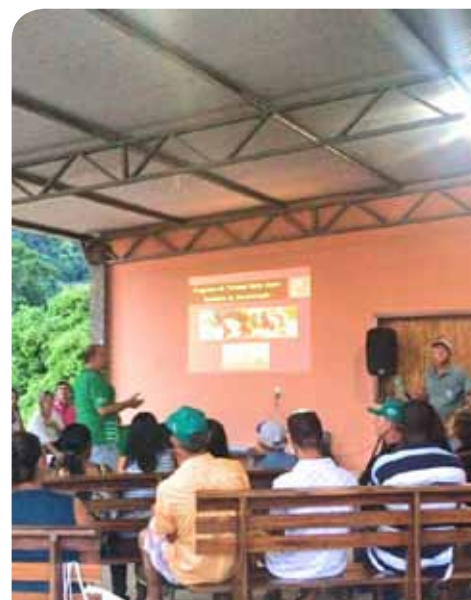
Mais de 40 agricultores das comunidades de Boa Vista e Alto São Vicente participaram

Ainda de acordo com o secretário, a iniciativa contemplará, também, as comunidades rurais de Independência e Bom Jardim. Com o projeto, será criada uma infraestrutura de suporte ao turista, com lanchonetes, pousadas, guias turísticos e transporte.