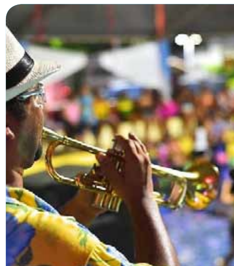
As dicas ajudam ao consumidor a ter dias de folia sem aborrecimentos

- A partir de duas horas, o passageiro pode exigir alimentação. Mais de quatro horas, a companhia tem de disponibilizar acomodação ou hospedagem e transporte. O passageiro, no caso de cancelamento da passagem, também tem