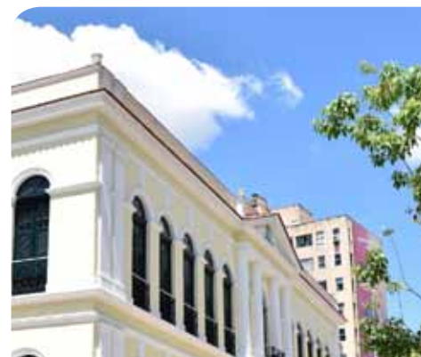
Apresentação dos novos titulares foi realizada na sexta-feira (22)

entre as quais as de pregoeiro municipal, presidente de Comissão Permanente de Licitação, gerente de compras e assessor jurídico.