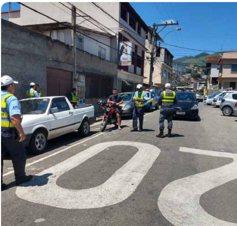
Oito motos foram removidas por irregularidades, nesta sexta (22)