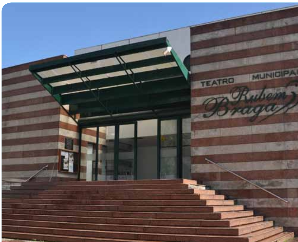
Podem participar artistas e grupos culturais de todo o país

A ficha de inscrição, bem como os documentos necessários para apresentação das propostas, estão no portal eletrônico da prefeitura: www.cachoeiro.es.gov.br , nas abas “Secretarias”; “Cultura e Turismo” e “Editais” e, também, no site do teatro: teatromunicipalrubembraga.com.br .