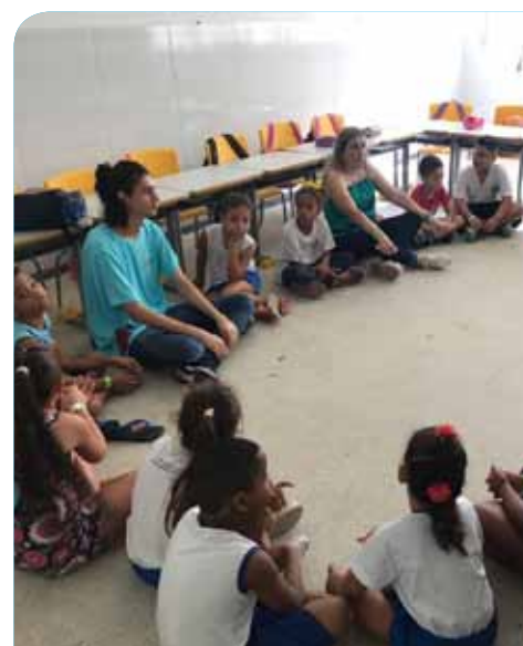
A Secretaria de Educação de Cachoeiro implantou, nessas unidades, o modelo pedagógico Escola da Escolha

Desde 5 de fevereiro (data de início do ano letivo na maioria das escolas municipais), eles trabalharam no planejamento das atividades sob instrução de formadores do Instituto de Corresponsabilidade pela Educação (ICE), de Pernambuco; do ES em Ação, de Vitória; e Movimento Empresarial Sul Capixaba (Messes), entidades com as quais a Secretaria Municipal de Educação firmou acordo de cooperação para