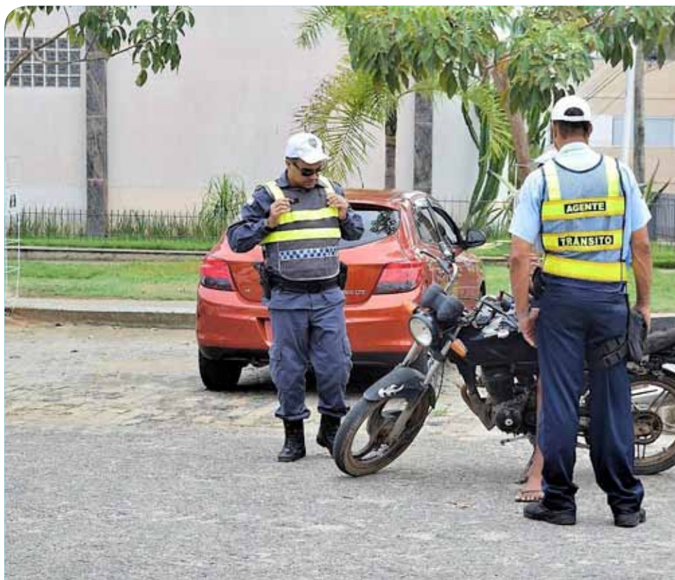
Na primeira ação, no bairro Independência, foram abordados 99 veículos e 140 pessoas