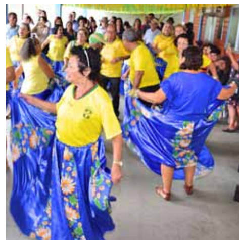
No local, idosos têm acesso a oficinas recreativas e atendimentos em saúde

a sexta-feira, das 7h às 16h. Mais informações: 3155-5375.