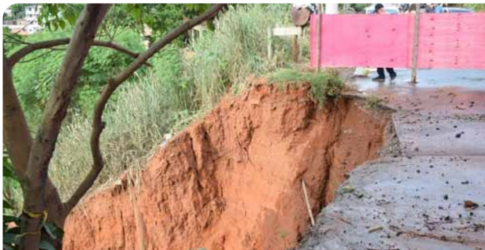
A via, que vem sofrendo com o processo erosivo, será recomposta

Além das intervenções na via Santo Francisco Cypriano, o bairro Coramara recebe obras de extensão da rede de drenagem na rua Paulina Vieira Bueno, para melhorar a captação de águas pluviais, com vistas a reduzir os riscos de alagamento e outros transtornos.