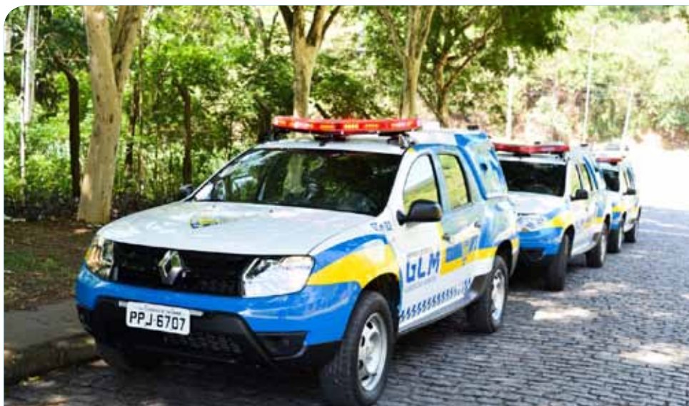
As operações começam já nesta semana e serão realizadas diariamente

“Essa interação será essencial para a inibição desses tipos de crime. Parabéns ao município por assumir e fazer sua parte”, completou o comandante Rubim.