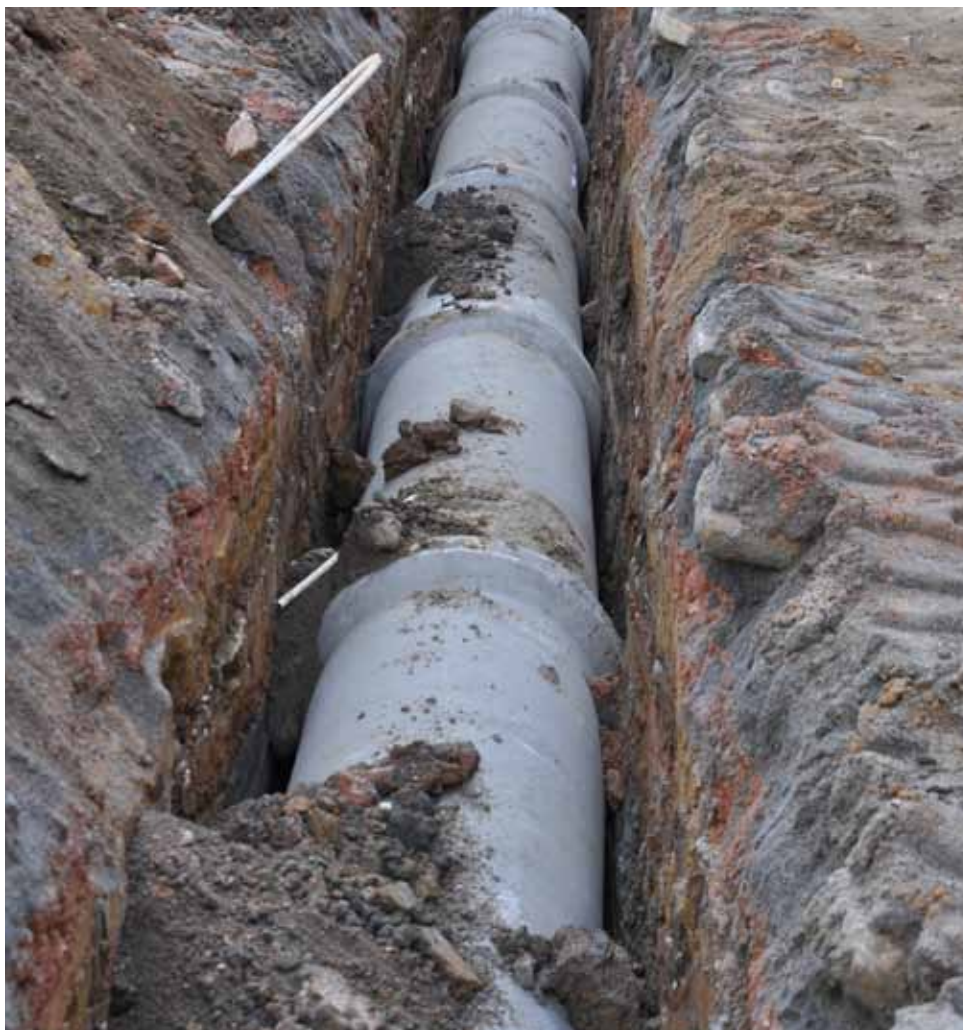
As vias vão ganhar rede de drenagem e pavimentação