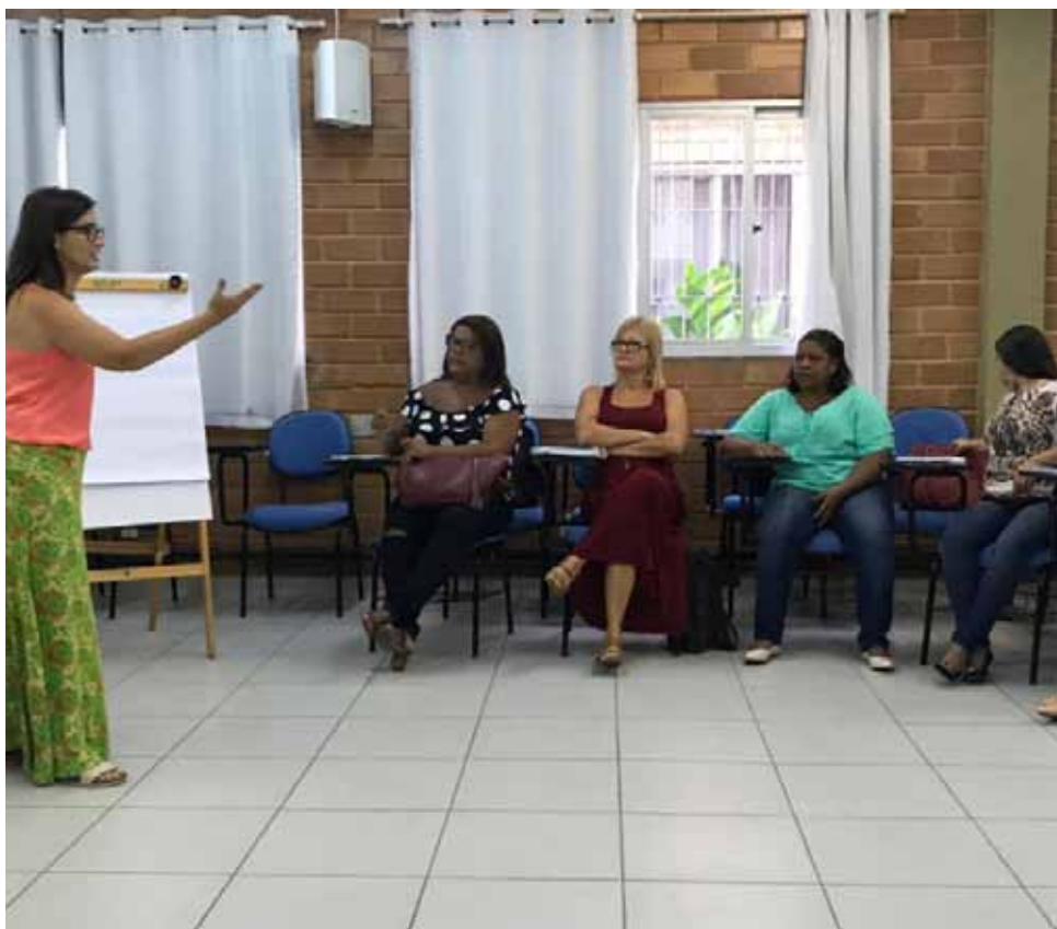
Por conta da capacitação, ano letivo nessas escolas começa no dia 20 deste mês

As atividades com gestores e pedagogos são realizadas no Centro de Referência, Pesquisa Capacitação do Professor de Educação Básica (Cecapeb) em Morro Grande. Paralelamente, os professores das duas escolas estão nas unidades aprofundando conhecimentos sobre a nova metodologia. “Durante toda a próxima semana,