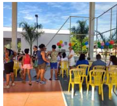
São palestras e outros atendimentos para alertar e orientar as comunidades

A abertura da campanha foi realizada na última sexta (1º). Na quadra de esportes do bairro Rui Pinto Bandeira, teve aferição de pressão arterial, teste de glicemia, imunização, dinâmicas e uma palestra com apoio da unidade de saúde do Aeroporto e do Núcleo de Apoio à Saúde da Família (Nasf) de Jardim Itapemirim, voltado aos adolescentes. Na unidade do bairro Elpidio Volpini (Valão), também teve palestra e realização de testes rápidos de infecções sexualmente transmissíveis (IST).