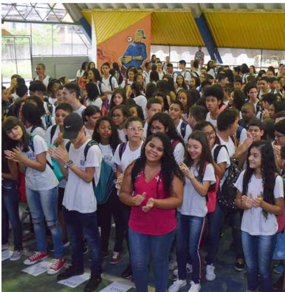
Na escola Galdino Teodoro da Silva, no bairro Jardim Itapemirim, a manhã foi de festa

Os números serão divididos nas seguintes modalidades: Arte circense, Performance de hip hop com grafite, Apresentações musicais infantis – interativas com bandas, Performance lúdica – bonecos de fantoches,