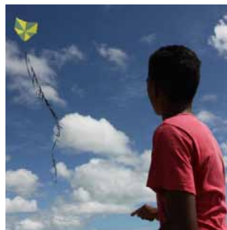
Crianças e adultos vão se encontrar no 1º Festival de Pipas de Cachoeiro

O 1º festival de Pipas tem o apoio da prefeitura de Cachoeiro, por meio da Secretaria de Esporte e Lazer (Semesp).