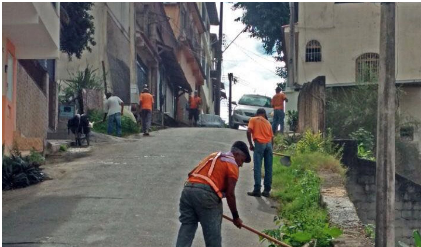
Durante a passagem pela escola, o prefeito Victor Coelho afirmou que o plano é ampliar a unidade

O bairro Alto Amarelo e o distrito de São Joaquim, em Cachoeiro, receberão ações especiais de limpeza até a próxima segunda-feira (30). O trabalho será realizado pelas equipes da Secretaria Municipal de Serviços Urbanos (Semsur).