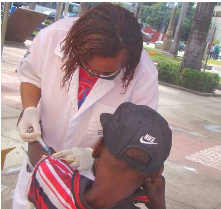
Equipe do Centro de Infectologia fará coleta de exames na praça Jerônimo Monteiro

Além de evitar as hepatites, a população adulta