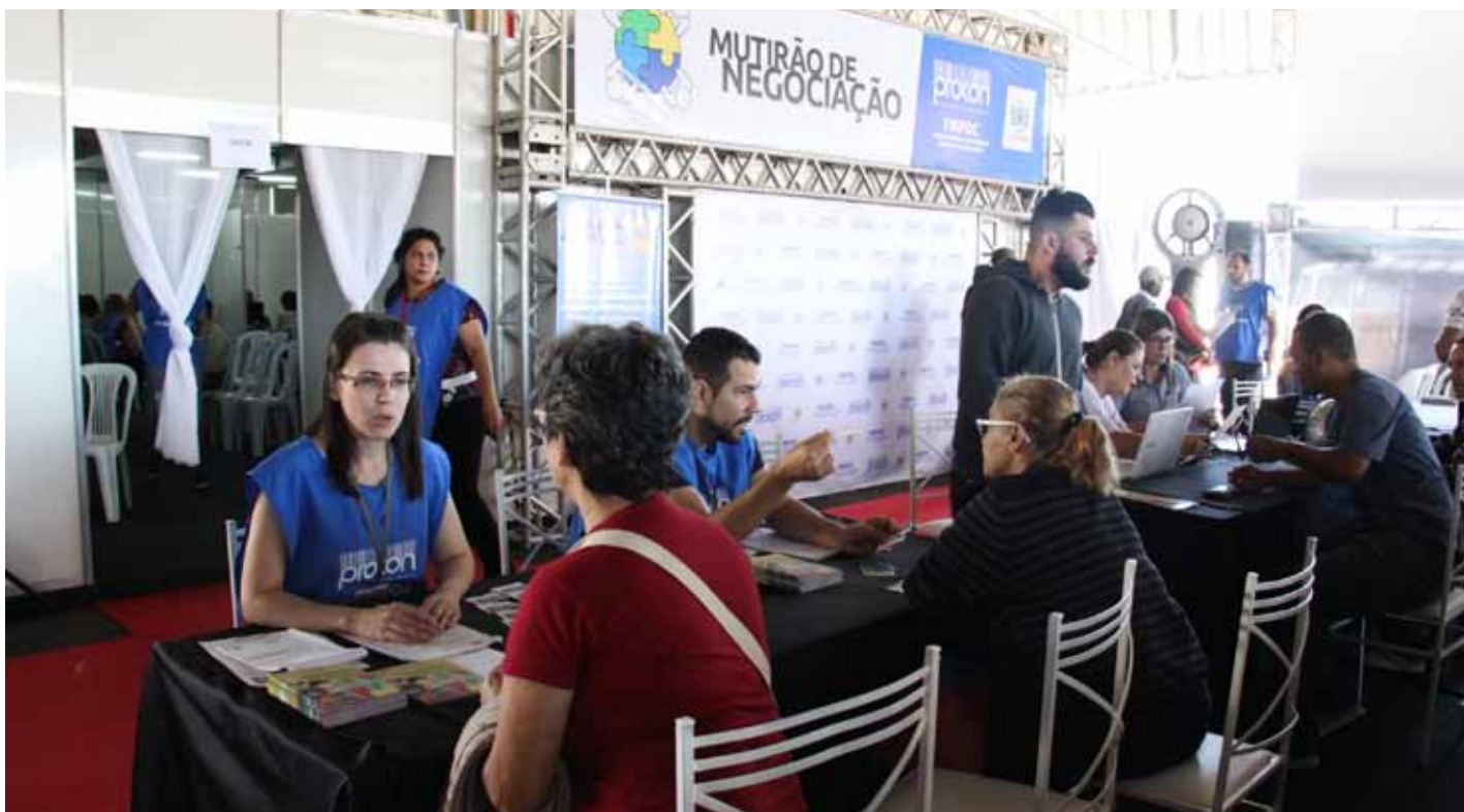
Uma das negociações mais expressivas foi a de uma dívida quitada com 98,27% de desconto

Por meio do 4º Mutirão de Negociação de Dívidas, o Procon de Cachoeiro realizou 746 atendimentos cujos passivos, somados em mais de R$ 1,8 milhão, foram reduzidos para cerca de R$ 385 mil, o que representou uma economia, de aproximadamente, R$ 1,4 milhão (78, 69%).