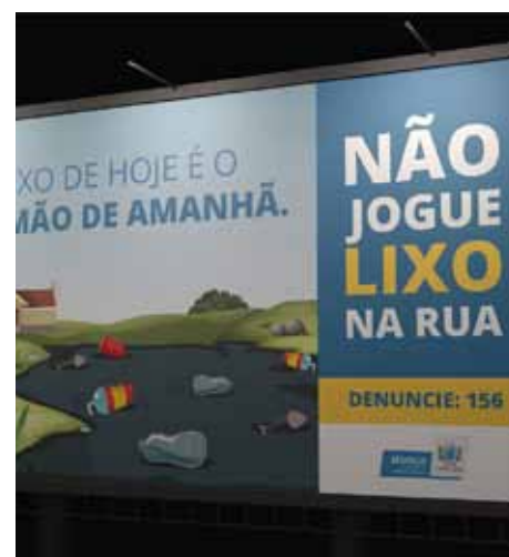
Uma placa de conscientização será instalada no local para alertar os moradores

também receberão, em breve, atividades como as programadas para o bairro Gilson Carone. O cronograma é elaborado pela Semsur.