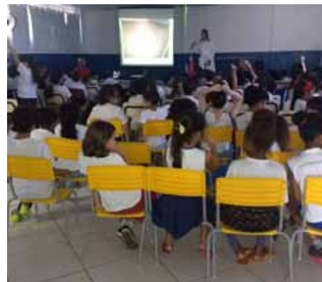
Atividades fazem parte de campanha nacional

reduzir a carga desses parasitas, que costumam causar anemia, perda de peso, dores abdominais, sangramento intestinal e diarreias frequentes, prejudicando o crescimento e o rendimento escolar.