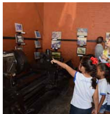
Atualmente, espaço abriga a exposição Meu pequeno Cachoeiro, com trabalhos de estudantes

Ela avalia, também, que os números devem melhorar ainda mais neste mês, por conta da Semana dos Museus e da 7ª Bienal Rubem Braga. “Ambos os eventos, promovidos em maio, colaboraram para a divulgação do espaço. E acreditamos que os novos horários de funcionamento também contribuíram. Esperamos continuar aumentando esses números”, finaliza.