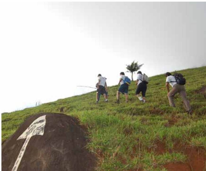
No próximo dia 10 tem caminhada até nascente no bairro São Geraldo, com vista para a Pedra do Caramba

“Buscamos diversificar as ações em comemoração ao Dia Mundial de Meio Ambiente, e as equipes atuarão junto a crianças, adultos e idosos. A expectativa é conseguir