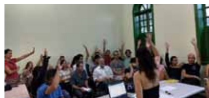
Documento para seleção de avaliadores já foi finalizado em reunião do Conselho de Política Cultural

Os outros R$ 550 mil serão direcionados para os editais deste ano: o de avaliadores, com previsão de lançamento para os próximos meses, e o de proponentes, previsto para o segundo semestre.