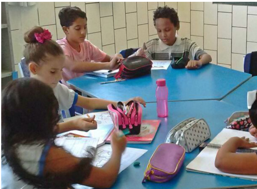
Benefício é concedido a alunos que participam das oficinas no Ciae Newton Braga

Em Cachoeiro de Itapemirim, estudantes da rede pública municipal de ensino inscritos em aulas extracurriculares do Centro Integrado de Atividades Educacionais (Ciae) Newton Braga, no bairro Ferroviários, têm direito à gratuidade no transporte coletivo da cidade.