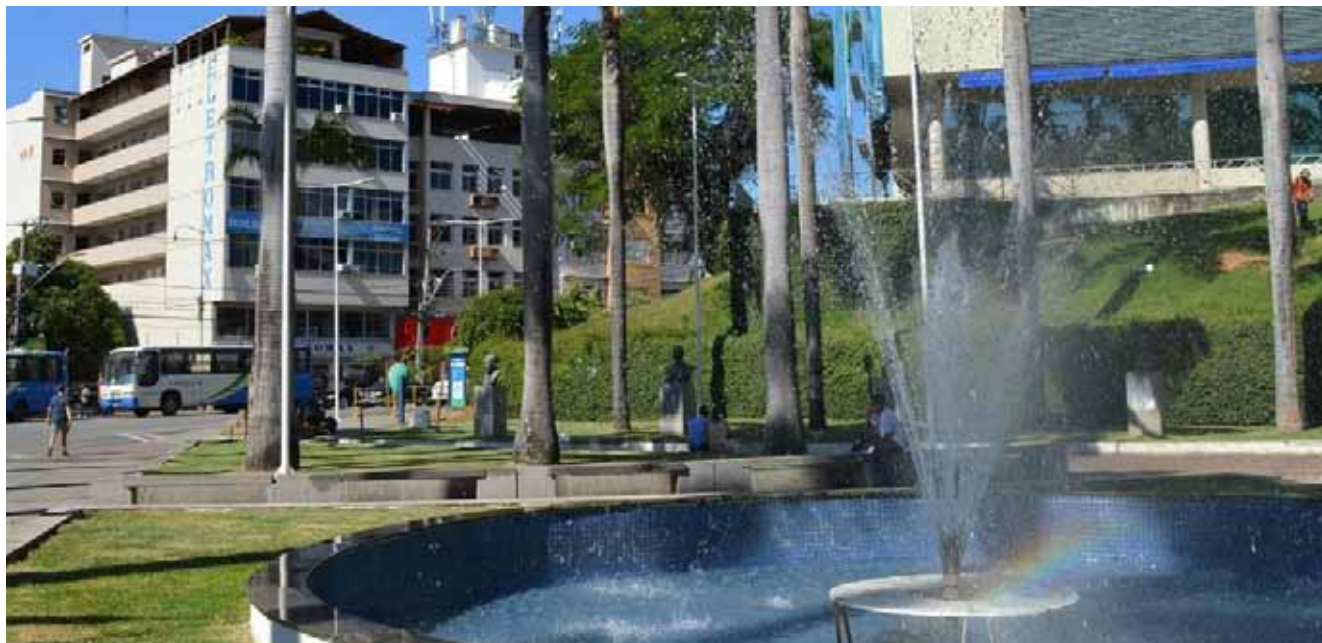
A Praça Jerônimo Monteiro vai receber apresentações culturais de estudantes e artistas do município

Na manhã deste sábado (24), estudantes se juntam à equipe do projeto Novos Talentos para uma série de atrações em alusão aos 151 anos de emancipação política de Cachoeiro, completados no domingo (25). Serão apresentações culturais e o desfile cívico, com concentração às 8h.