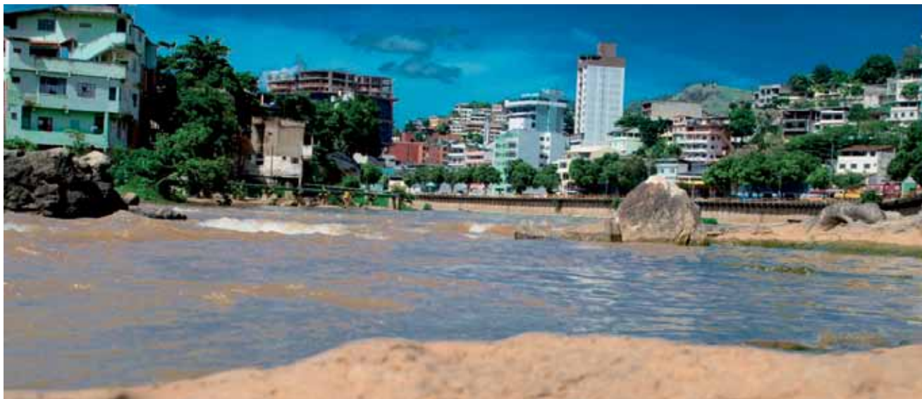
A iniciativa inclui a recuperação e também conscientização sobre os afluentes do Rio Itapemirim

Estamos no mês das águas, e algumas atividades na programação em Cachoeiro, para a segunda quinzena, já estão definidas. Uma delas é o lançamento do projeto Nascentes Vivas, que vai cadastrar propriedades e investir em mecanismos para preservação das nascentes.