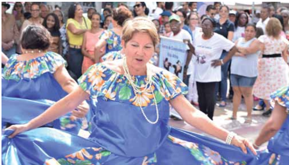
Abertura da programação contou com diversas atrações

“É com imenso prazer que recebemos hoje cada uma de vocês. As mulheres são tão especiais em