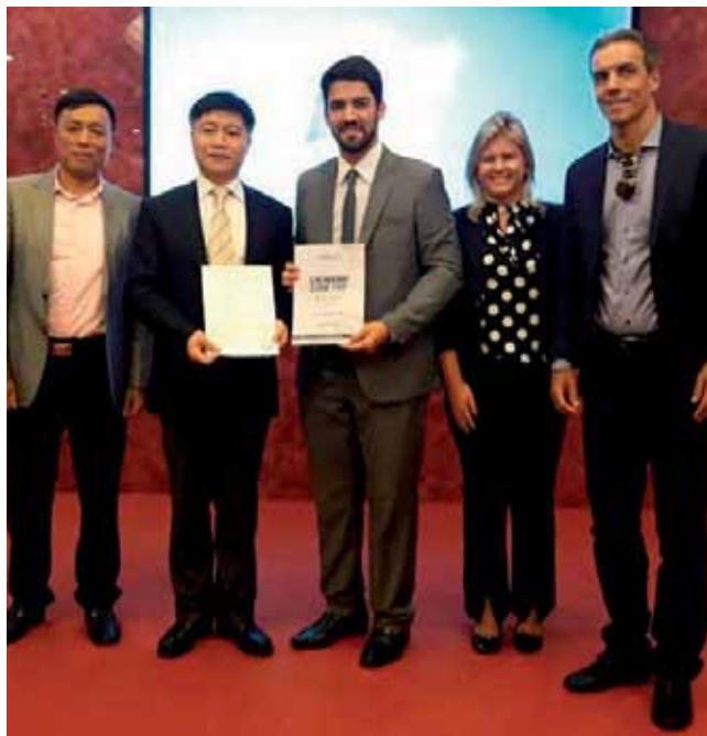
O prefeito Victor Coelho, que lidera o grupo, também participou de rodada de negócios entre empresas brasileiras e chinesas

“As conversas presencialmente já têm gerado bons frutos, e nós vamos fornecer incentivos para que as empresas migrem para nossa cidade para geração de emprego e renda. Tenho certeza que a nossa participação aqui na China tem sido muito proveitosa e, aprofundando os diálogos daqui para a frente, teremos resultados muito positivos para Cachoeiro”, comemorou o prefeito.