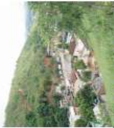
Vista frontal do setor Parque Laranjeiras

Descrição: Deslizamento planar em solo residual vermelho, com espessura superior a 10 metros. Em parte da encosta existe uma obra de contenção, que precisa ser estendida ao restante do setor. Não há nenhum tipo de rede de drenagem na encosta, o que propicia deslizamentos e a erosão da mesma. Quantidade de imóveis em risco: 10 Quantidade de pessoas em risco: 40