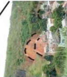
Vista do setor de risco para onde a obra deve ser estendida

Bairro Parque Laranjeiras CI-SR-18 Av. Governador Jones dos Santos Neves