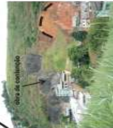
Obra de contenção (concreto projetado) e cicatrizes de deslizamento