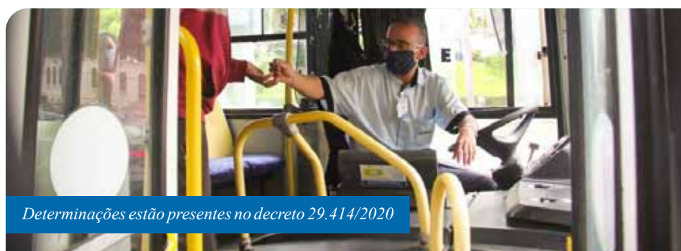
Determinações estão presentes no decreto 29.414/2020

Para denunciar o descumprimento de regras previstas para táxis e serviços de transporte por aplicativo, está disponível o telefone o 153, do Disk Aglomeração.