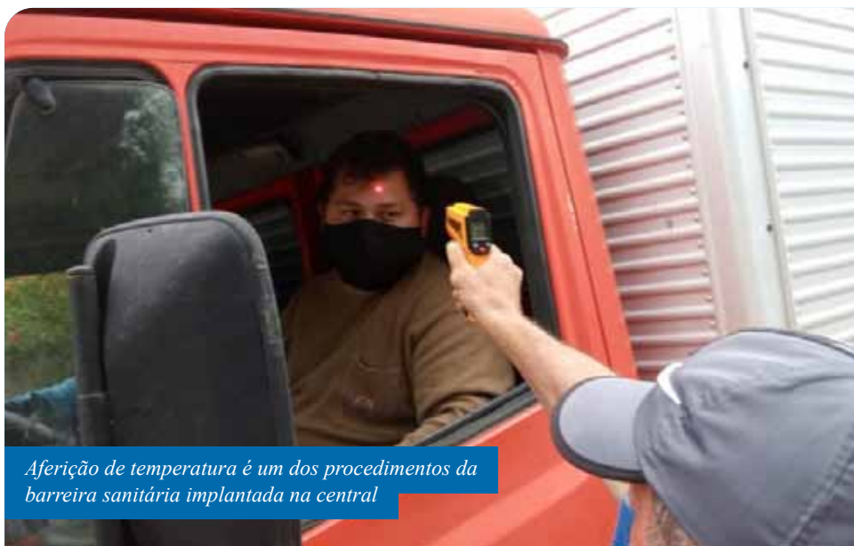
Aferição de temperatura é um dos procedimentos da barreira sanitária implantada na central

Ainda de acordo com Valladão, outra medida a ser implantada no acesso ao Ceasa, nas próximas semanas, é a instalação de um “rodolúvio”, espécie de tanque-raso com hipoclorito de sódio, para desinfecção dos veículos.