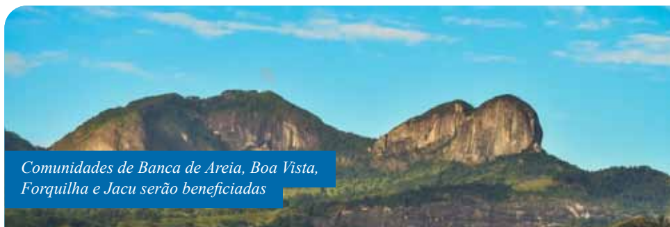
Comunidades de Banca de Areia, Boa Vista, Forquilha e Jacu serão beneficiadas

O projeto de Banca de Areia, localizada no distrito de Pacotuba, é voltado à estruturação de um pavilhão para eventos, com a construção de lanchonete, banheiros e novos vestiários. O da localidade de Boa Vista, que fica no distrito de São Vicente, é voltado à estruturação de uma área de recepção a turistas próximo à Pedra da Penha. Na comunidade de Forquilha, no distrito de Burarama, será construído