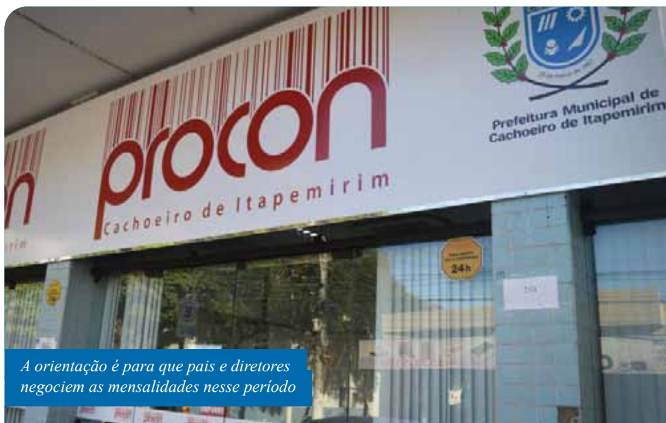
A orientação é para que pais e diretores negociem as mensalidades nesse período