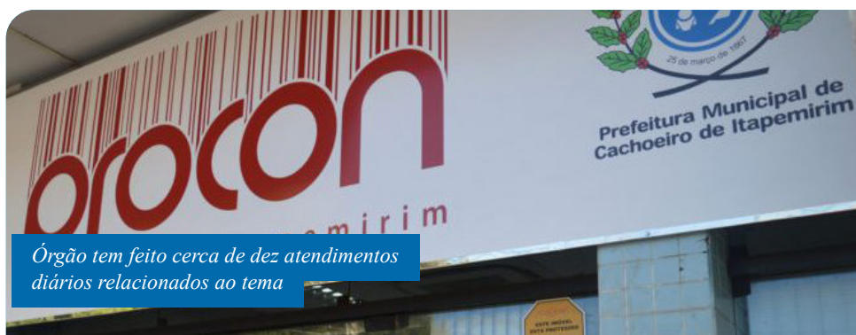
Órgão tem feito cerca de dez atendimentos diários relacionados ao tema

O Procon de Cachoeiro está atendendo ao público na parte da tarde, das 12h às 17h. O endereço é rua Bernardo Horta, nº 210, bairro Maria Ortiz. Quem optar pelo atendimento telefônico pode ligar para 3155-5262 e 3155-5276, no mesmo horário.