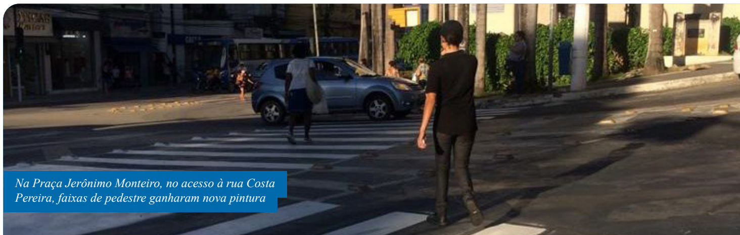
Na Praça Jerônimo Monteiro, no acesso à rua Costa Pereira, faixas de pedestre ganharam nova pintura

A Prefeitura de Cachoeiro está revitalizando a sinalização horizontal em alguns dos principais trechos de circulação do município, para garantir melhores condições de tráfego aos motoristas e pedestres e aumentar a segurança nas vias públicas.