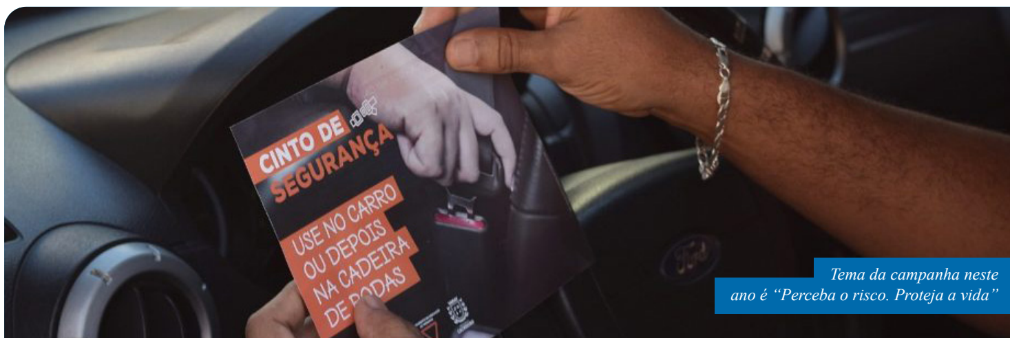
Tema da campanha neste ano é “Perceba o risco. Proteja a vida”

Neste ano, as ações orientativas da campanha nacional Maio Amarelo serão realizadas de maneira virtual, devido à medida preventiva de isolamento social, para conter o avanço do novo coronavírus.