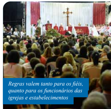
Regras valem tanto para os fiéis, quanto para os funcionários das igrejas e estabelecimentos

“O governo estadual já havia permitido, com restrições, a realização de atividades em espaços religiosos. O que estamos fazendo, agora, é estabelecer critérios claros de funcionamento em nível municipal, garantindo, minimamente, que as práticas confessionais sejam realizadas de forma segura, tanto para os fiéis, quanto para os funcionários das igrejas e templos”, explica o prefeito Victor Coelho.