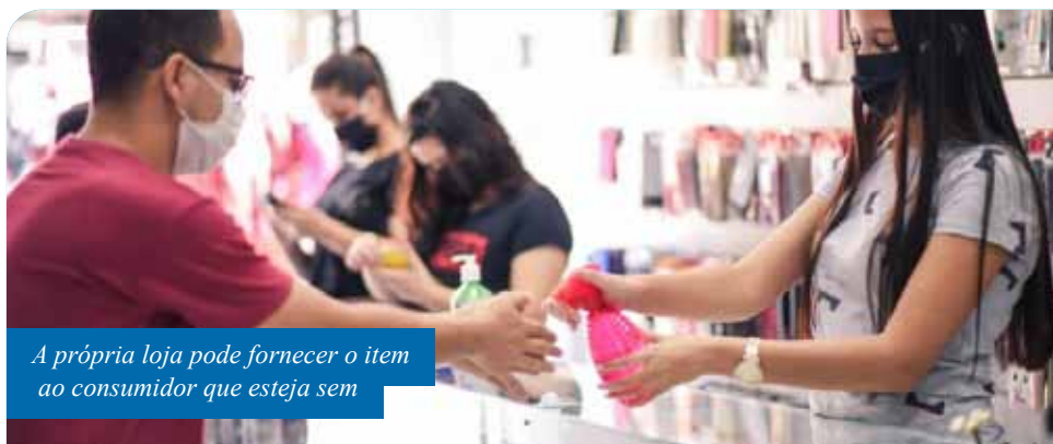
A própria loja pode fornecer o item ao consumidor que esteja sem

Também nesta quinta, a Prefeitura fez outras duas alterações no decreto sobre o funcionamento das atividades econômicas. O ramo de óticas especializadas foi inserido no turno das atividades autorizadas a funcionarem de segunda a sábado, das 8h às 16h. Já o turno das atividades no interior