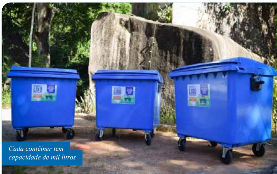
Cada contêiner tem capacidade de mil litros

“Para que a coleta de lixo com suporte dos contêineres funcione bem, a colaboração da população é fundamental. Todos devem continuar respeitando os dias e horários da coleta para